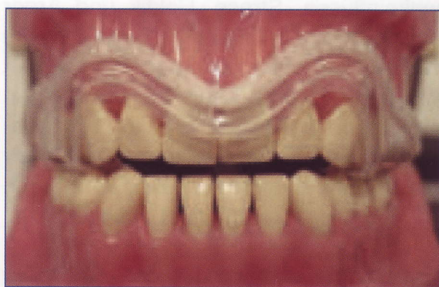
Aqualizer Classic design

„Aqualizer high“ werden für Patienten mit Tiefbiss oder Deckbiss empfohlen, sowie für Patienten, die aufgrund ihrer okklusalen Verhältnisse eine deutliche Anhebung der Bisshöhe benötigen. Durch die größere Menge an Flüssigkeit wird der "Aqualizer High" etwas fester, sodass einige Patienten das Tragen als weniger angenehm empfinden.