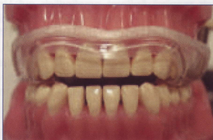
Aqualizer Ultra design