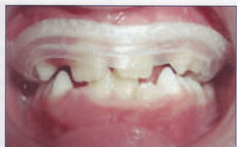
Aqualizer Ultra-Mini design

Aqualizer Ultra: ist die neue verbesserte Form des ursprünglichen Designs (Classic). Diese Ausführung hat einen deutlich besseren Tragekomfort. Empfindliche Patienten sollten dieses Modell wählen.